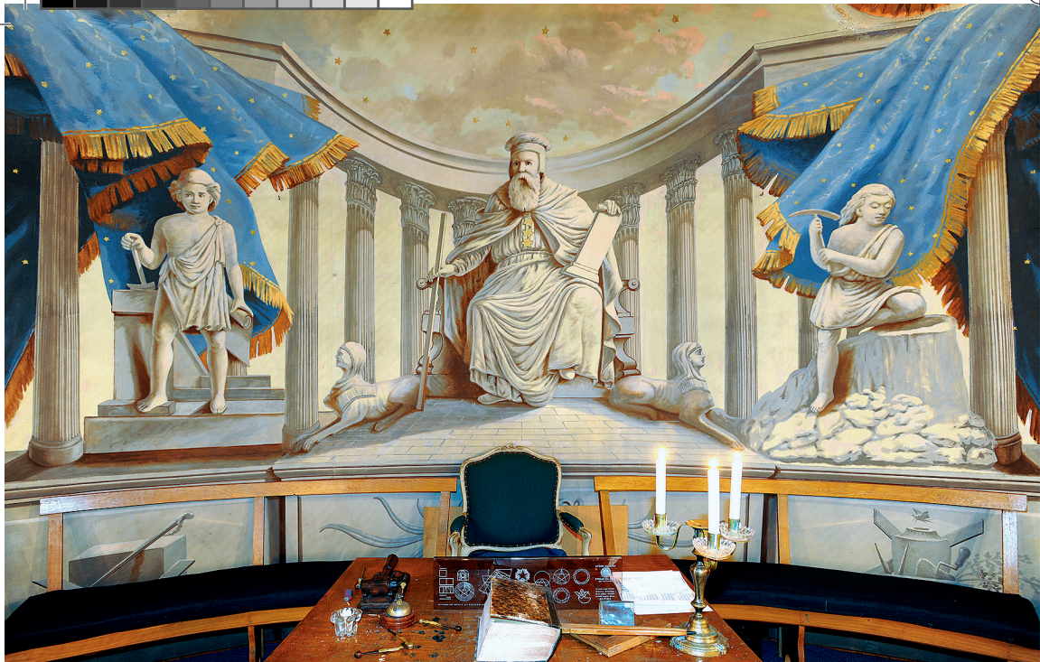
Loge «Les Vrais Frères Unis», Le Locle.

Die Gesellschaft für Schweizerische Kunstgeschichte GSK lädt Sie mit der Loge Modestia cum Libertate herzlich ein zur Präsentation des druckfrischen Bandes La Société d'histoire de l'art en Suisse SHAS se joint à la loge Modestia cum Libertate pour la présentation de l'ouvrage