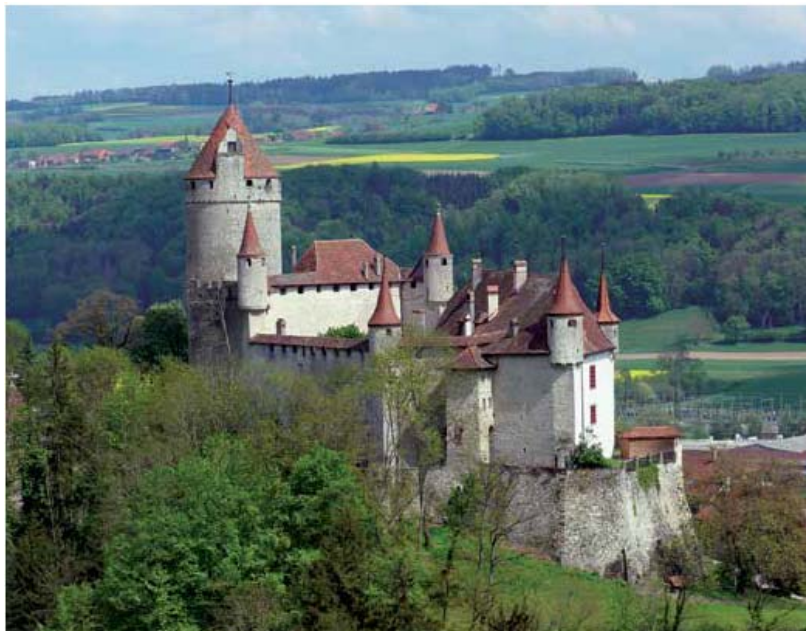
Image 4. Le château de Lucens, reconstruit à la fin du XIII e siècle par l'évêque Guillaume de Champvent.