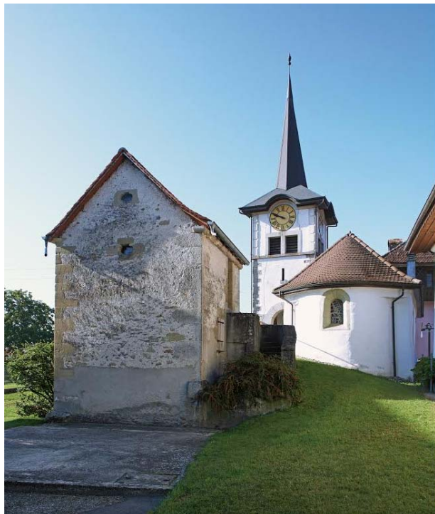
Image 6. A Sassel, la chapelle forme un ensemble remarquable avec la petite maison « carrée » du XVIII e siècle.