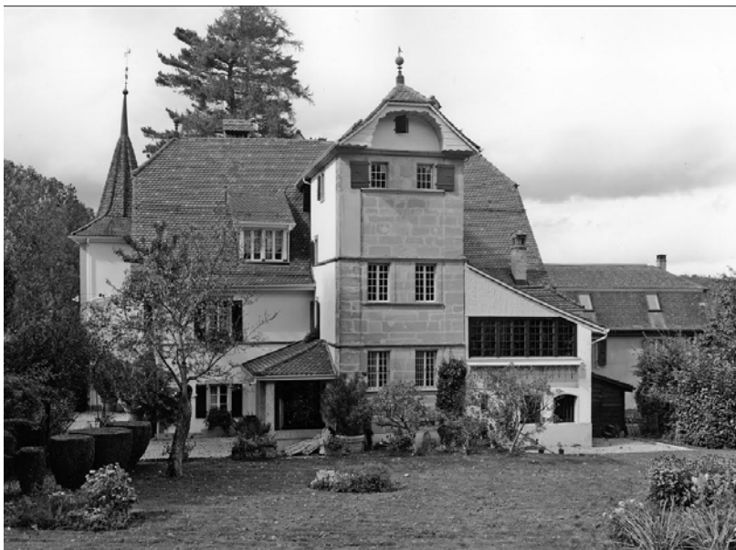
Image 5. Le château de Seppey, à Vulliens, reconstruit à la fin du XVII e siècle.