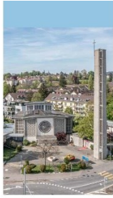
Bernhard Furrer · Regula Hug Die Kirche Bruder Klaus in Bern