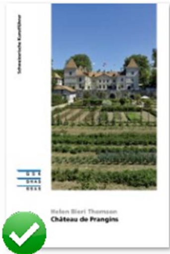
Image 7 Titelseite Deutsch

Die Titelseite des Schweizerischen Kunstführers «Château de Prangins» aus dem Verlag der Gesellschaft für Schweizerische Kunstgeschichte GSK.