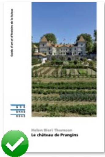
Image 8 Page de titre / français

Couverture du guide «Le château de Prangins» édité par la Société d'histoire de l'art en Suisse SHAS.