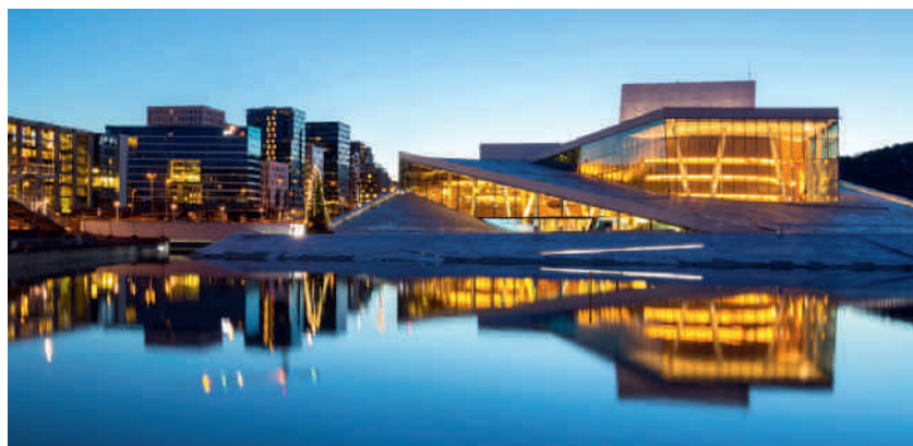
Gletscheroper, Oslo.