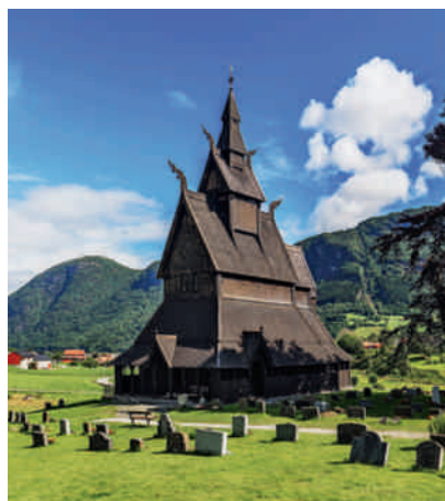
Stabkirche Hopperstad.

Am Morgen durchstreifen wir die authentischen Räume einer Hansestube: Wie ass und schlief man damals? Zum Abschluss der Reise ausführlicher Besuch der Gemäldegalerie mit eindrucksvollen Werken von Edvard Munch. Am späteren Nachmittag Rückflug nach Zürich.