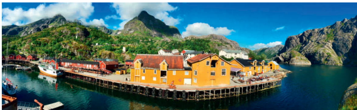
Der Nusfjord, Lofoten.

Frühstück an Bord des Postschiffs, und dann lässt man die Küste Helgelands an sich vorüberziehen: die Sieben Schwestern, Polarkreis, Ankunft in Brønnøysund. Wir wandern auf einfachen Wegen zum Torgatten, dem Berg mit dem geheimnisvollen Loch in der Mitte. Übernachtung in Brønnøysund.