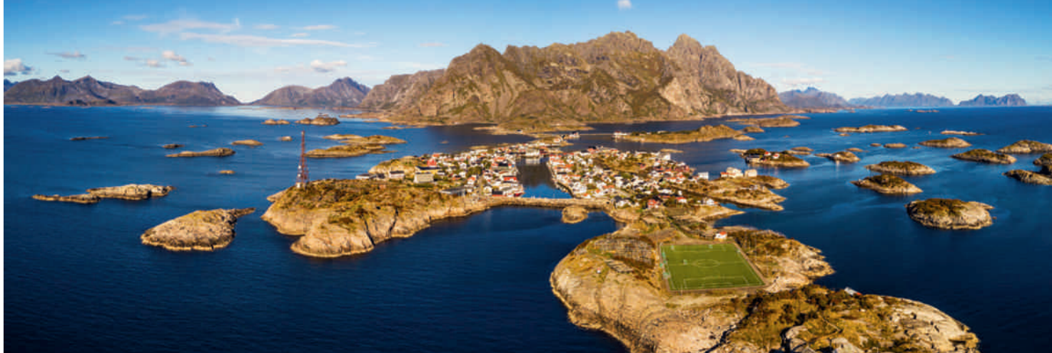
Blick auf Henningsvær, Lofoten.