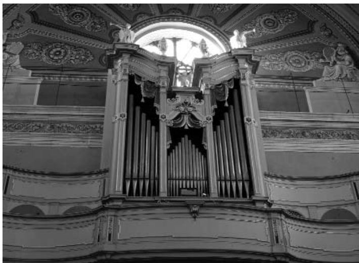
6 Bellinzona, chiesa Collegiata, cassa con canne dell'organo di Graziadio Antegnati (1588).

Die erste Orgel der Stiftskirche SS. Pietro e Stefano in Bellinzona wurde 1588 vom berühmten Orgelbauer aus Brescia, Graziadio Antegnati, geschaffen. Sie wurde in der vierten Kapelle auf der Nordseite der Kirche auf einer Empore aufgestellt, die von Giovanni Battista Ossone aus Pavia erbaut und durch den Maler Bartolomeo Gorla aus Bellinzona vergoldet wurde. Zweihundert Jahre später, im Zusammenhang mit einer stilistischen Umformung des Kirchenraums, wurde sie durch eine neue Empore von Diffendente Cerino aus Cerro Maggiore bei Mailand ersetzt (1791). Das Instrument aus der Renaissance blieb indessen erhalten und wurde mit zahlreichen neuen Registern durch den Mailänder Paolo Chiesa erweitert. Die 1998 restaurierte Orgel gilt heute als eine der wertvollsten in der Schweiz.