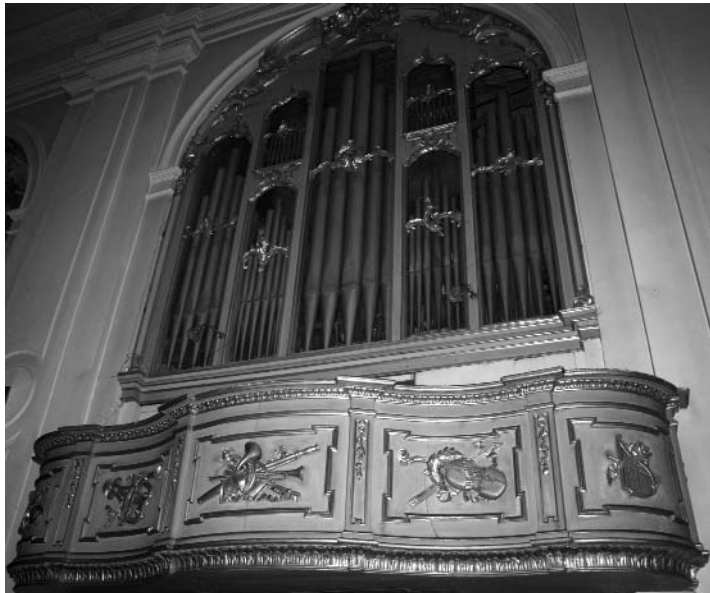
7 Cerro Maggiore (provincia di Milano), chiesa parrocchiale, la cantoria settentrionale dell'organo.