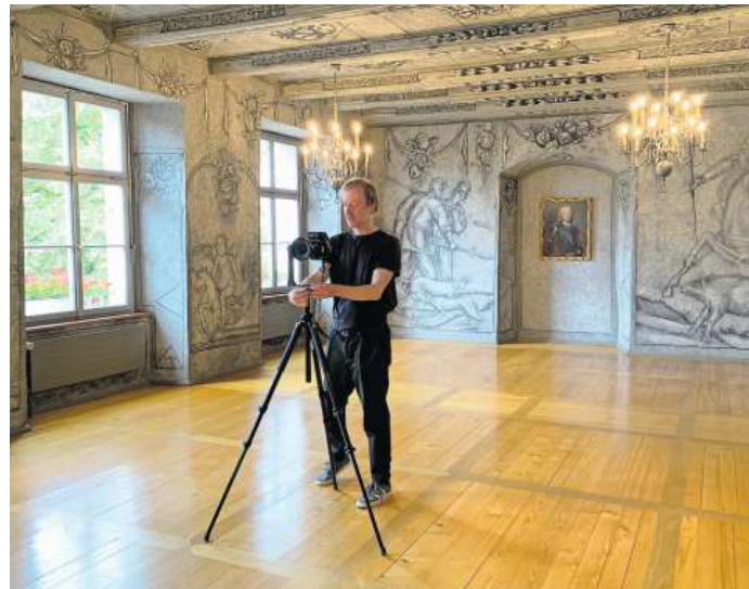
Exaktes Arbeiten ist erforderlich: Die Stadt Laufen stellte der Gesellschaft für Schweizerische Kunstgeschichte den Roggenbachsaal zur Erstellung einer Rund-sicht zur Verfügung. Der Fotograf Dirk Weiss schoss Anfang Juni die benötigten Bilder.

Um eine 360°-Ansicht zu erstellen, wurde der Roggenbachsaal zuerst kom-