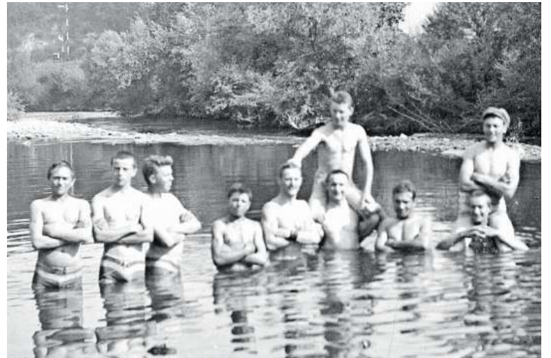
Badespass zum Ersten: Mitglieder des Schwimmklubs, damals noch Schwimm-Club Laufen im Jahr 1911.

In den Sommerwochen werden auf dieser Seite Schwarzweissbilder vergangener Tage aus Laufen zu sehen sein, die in den Sommermonaten entstanden sind und Laufnerinnen und Laufner in ihrer Freizeit zeigen. Die Fotos stammen allesamt aus dem Fundus des Museums Laufental. (stl)