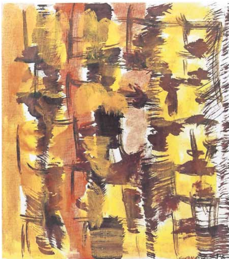
"Senza titolo", 1982, olio su tela. A sinistra: "Senza titolo", 2000, acrilico.

ni del grigio a sostenere strutture sempre mosse, progressive. Al loro interno si rendono possibili, aprono pertugi, diventano percorribili tra il qui e l'altrove, che non è un altro luogo ma un'altra dimensione dell'esistere. Anche lui, Cavalli, come noi orellianamente «oriundo dell'aldilà». Che è un concetto eminentemente filosofico, ed è questa la seconda ragione dell'andirivieni tra le quinte dei suoi dipinti. È ansioso di trovare dell'altro, qualcosa di ulteriore, che sveli, che chiarisca il possibile: all'interno dei segni e delle forme pittoriche mantenute in tensione sul filo del ritmo, ma ancor di più dentro le domande che assillano. Domande che dalla pittura possono avere risposte? Cavalli non dice ma insiste in questa direzione attraverso un lavoro progressivo, lievemente incalzante, ben strutturato, quindi consapevole, cercato e voluto.