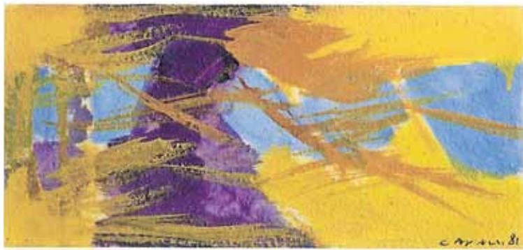
Altre due opere di Cavalli, da sinistra a destra: "Senza titolo", 1982, olio su tela. "Senza titolo", 1981, olio su tela.

Spazio d'Arte Palazzo Pollini, Mendrisio, "Scelte inedite per Massimo Cavalli" (dipinti 1982-2006). Sabato e domenica 10-12 e 14-18, o su appuntamento (078 873.78.98). Fino al 18 luglio.