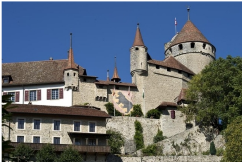
Le château de Lucens figure logiquement dans l'ouvrage.

Patrimoine Le 128e volume de la collection «Les monuments d'art et d'histoire» est consacré à Lucens et à sa région.