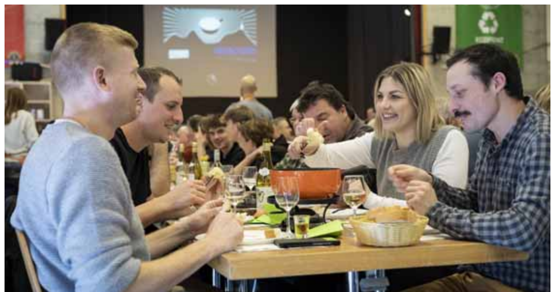
Les 12 Heures du fromage se sont à nouveau déroulées dans la bonne humeur.

Cette année, les recettes reviendront à trois associations: les scouts du Val-de-Ruz pour un camp à l'étranger, l'association ProCSVR (Cercle scolaire