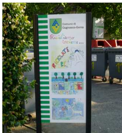
Riciclaggio a Cugnasco-Gerra

Comune. Nel corso di quest'anno scolastico che sta per terminare gli allievi, coerentemente con il marchio di "Città dell'energia" ottenuto lo scorso anno, hanno approfondito il tema del riciclaggio dei rifiuti, che rappresenterà anche il filo conduttore della festa di chiusura dell'Istituto scolastico comunale. Cugnasco-Gerra fa la sua parte contribuendo direttamente a una politica energetica e ambientale concreta e coinvolgendo efficacemente i vari attori presenti sul territorio, in questo caso le future generazioni.