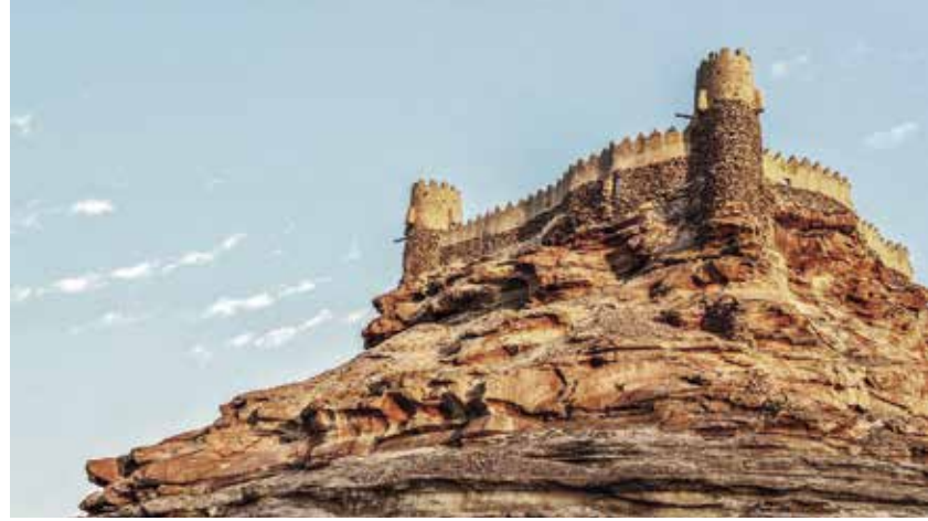
Die Festung Zaa'bal in Sakaka.

Vielleicht bleibt noch Zeit für einen Spaziergang durch die riesige Dattelpflanzung, bevor wir gegen Osten ans Ufer des Persischen Golfes aufbrechen. Nach Ankunft in Dammam besuchen wir das Nationalmuseum sowie das Abdul Aziz Culture Center for World Culture, eine moderne Anlage, zu der unter anderem eine bedeutende, mit modernster Technik ausgestattete Bibliothek gehört. Ein Spaziergang entlang der Uferpromenade schliesst den Tag ab.