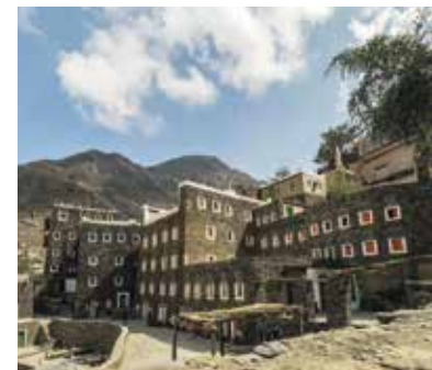
Jemenitisch geprägte Häuser in Rejal Alma.

Melden Sie sich für diese Reise mit dem Talon am Ende des Hefts an, per Telefon 031 308 38 38 oder per E-Mail an: gsk@gsk.ch