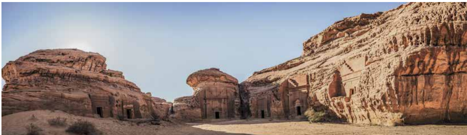
Grabanlagen der Nabatäer.