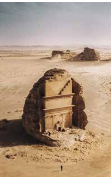
Das eindrückliche Qasr al-Farid in Medain Saleh.

Auftakt unserer Besichtigungen bilden die osmanischen Häuser der mächtigen Händlerfamilien aus dem 19. Jahrhundert. Das bedeutendste, das Haus der Familie Nasif, beherbergte einst auch König Abdul Aziz, der nach der Eroberung von Dschidda 1925 hier übernachtete. Die reizvolle Corniche am Ufer des Roten Meeres führt zu einem kleinen Park mit moderner Kunst und zum lebhaften Fischmarkt. Im Abdul-Rauf-Khalil-Museum besichtigen wir die Sammlung archäologischer und ethnographischer Exponate.