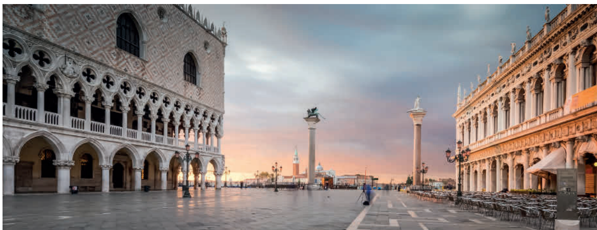
Auf dem Markusplatz.